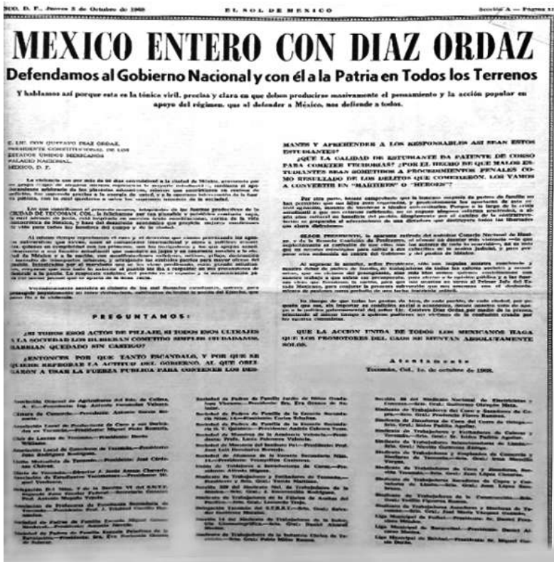
Figura 3. El Sol de México , 3 de octubre de 1968, Despliegado de apoyo a Díaz Ordaz tras los acontecimientos de Tlatelolco del día anterior