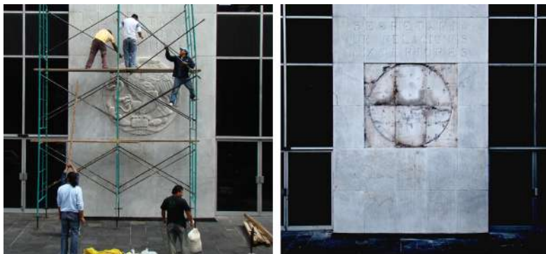
Figura 3. Imágenes de la acción Desmantelamiento y reinstalación del escudo nacional