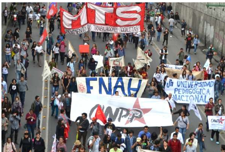
marcha 2 de octubre, 2017.

Pero una herencia oficial que marca el discurso del gobierno y de los medios de comunicación, un discurso que se enfocó en formar una imagen negativa de la disidencia contra el gobierno, contra la protesta social, en contra de aquellos que se movilizan, que luchan, que se atreven a levantar su voz.