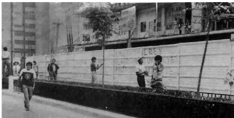
Figura 4. Estudiantes pintan leyendas políticas en el DF

LAS LEYENDAS tradicionales en las bardas de la ciudad reclamando cambios políticos, solamente sirvieron para ensuciar más el paisaje, de por sí oscuro por el cotidiano smog. Los normalistas no actuaron precisamente a la altura de sus disciplinas culturales.