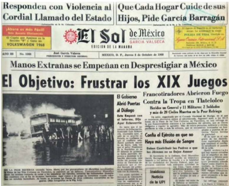
Figura 1. Primera plana: “Frustrar los XIX Juegos”

Fuente: El Sol de México , 3 de octubre de 1968.