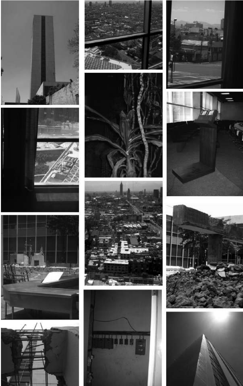
Figura. 2. Imágenes de la serie Estudio fotográfico de Tlatelolco